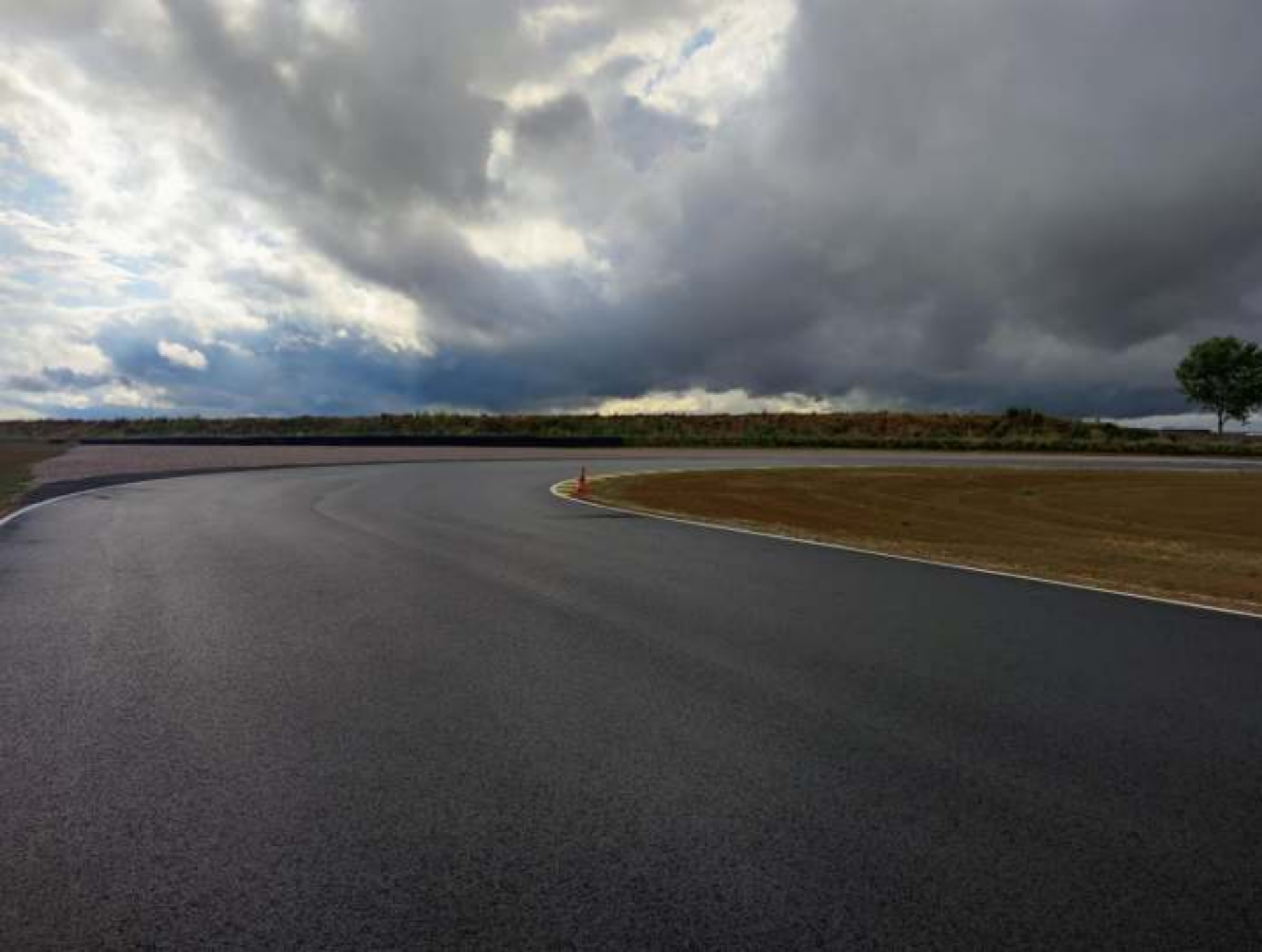
Kurve 7 mit der grosszügiger Auslaufzone im Hintergrund