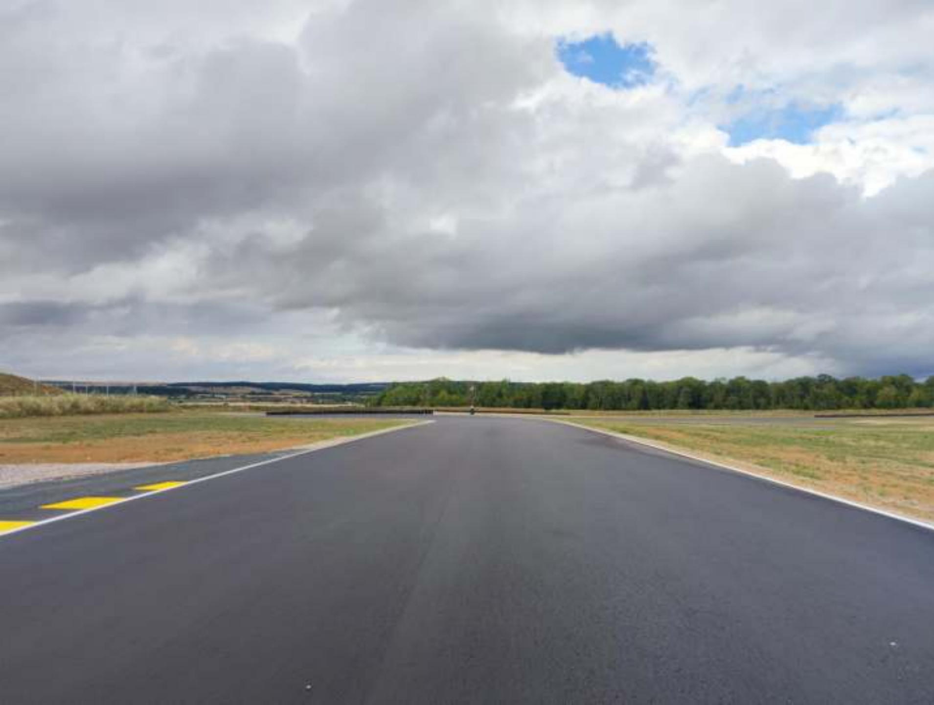
Kurvenausgang Kurve 7 mit Blick auf Kurve 8