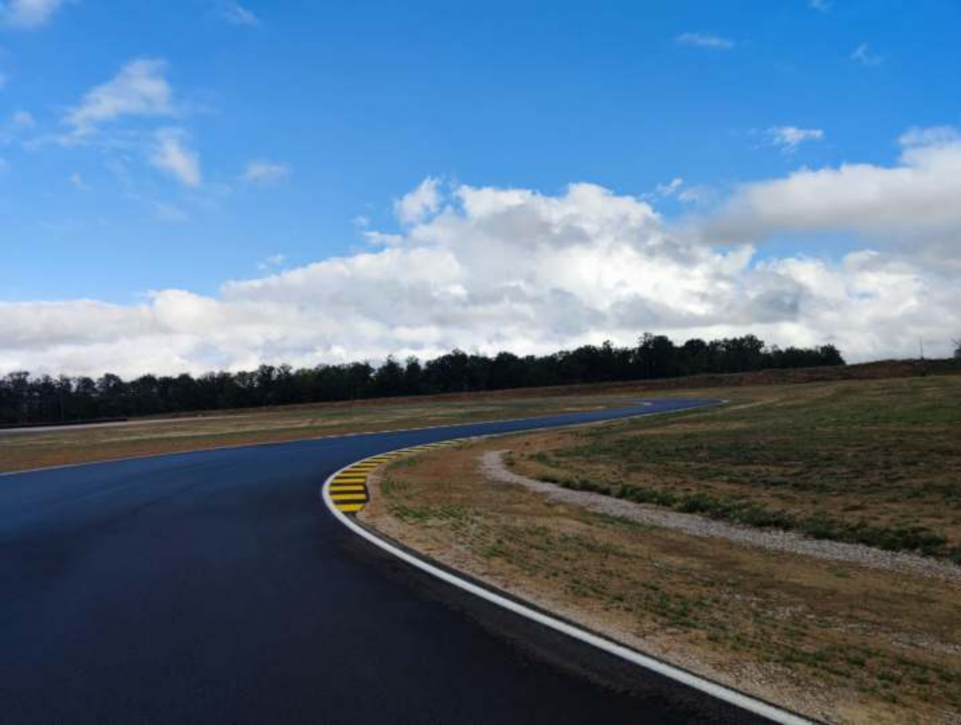
Kurve 10 mit Kurve 11 im Hintergrund